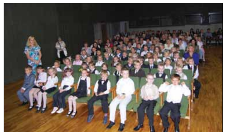
• 1. septembris Olaines sākumskolā Jaunolainē